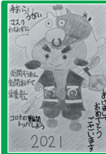
今年のトツパ丸賞受賞作品♪

♥あけましておめでとー!毎年行っている年賀状コンクールの審査をして、トツパ丸賞を選んだよ♪ 今年もたくさんの応募ありがとね! みんなの作品を見て、かわいいものやかっこいいものがいっぱいあって、年明けからとてもハッピーな気持ちになった♪ また来年も楽しみにしてこーっと!