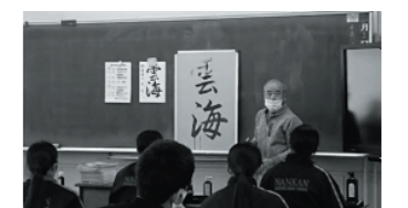
(中学校書初め大会の様子)