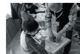
(伝統的工芸学習事業の様子)

町内小学校の6年生は、町内窯元の指導のもと、小学校生活最後の卒業記念製作に、手びねりによる作陶体験に挑みました。児童はお茶碗やカップなど思い思いの素敵な作品を完成することができ、大変貴重な体験をしました。陶器・梅まつりで展示予定でしたが、残念ながら中止となりましたので、各小学校で展示しました。