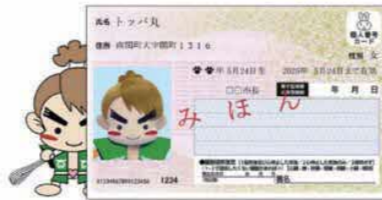
〈マイナンバーカード〉

利用の際には、マルチコピー機にマイナンバーカードをセットし、画面の説明に従い利用者証明用電子証明書の数字4桁の暗証番号を入力してください。