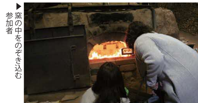
▶窯の中をのぞき込む参加者

熊本市からの参加者は「思った以上に手間がかかってびっくりした。炎がとてもきれいだった」と話しました。