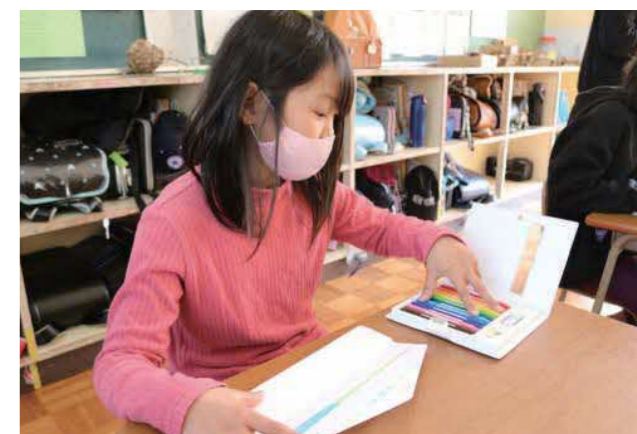
▲お礼のメッセージを描いている様子