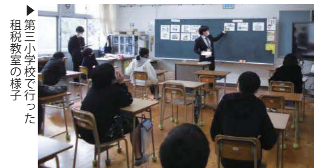
▶第三小学校で行った租税教室の様子