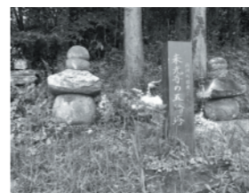
▲来光寺の五輪塔(外観)

先日、南関町の情報発信に関する取材・撮影で県の重要文化財(建造物)に指定されている豊永地区の「来光寺の五輪塔」を観に行ってみました。鎌倉時代に一遍上人が開いた時宗の信者を供養するために建てられたもので、石質溶結凝灰岩でできています。 歴史的にも重要な場所を確認することができ、貴重な経験ができました。今後も町の歴史や特徴などの取材・撮影を行なっていきたいと思っています。(平野)