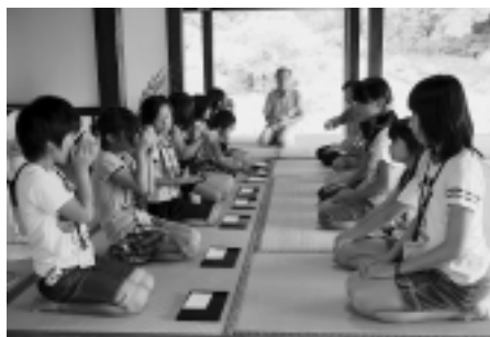
抹茶のお点前実習