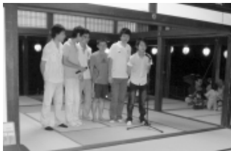
外国の方によるパフォーマンス