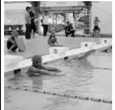
ドキドキのスタート

7月16日(土)に南関町B & G海洋センターで南関町小学生水泳大会が開催され、町内の小学生59名が参加しました。みんな日頃の練習の成果を発揮していました。