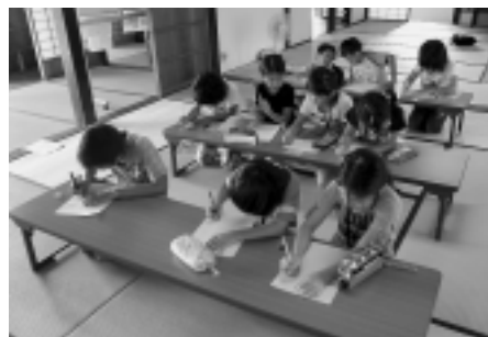
感想を書いています