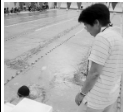
新記録連発の今大会