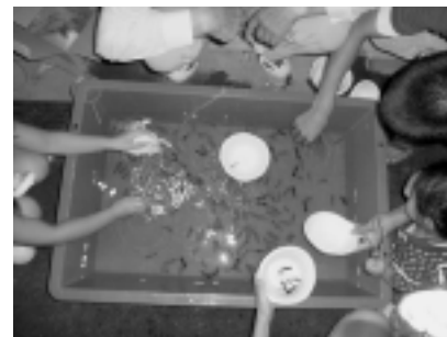
金魚すくいやかき氷も