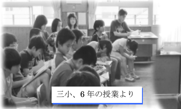
三小、6年の授業より