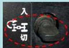
前輪増速機構の解除