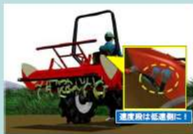
十分低い速度段にする