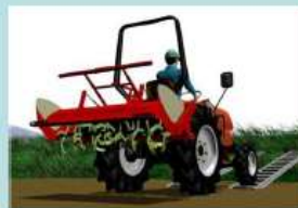
できるだけゆっくり発進する