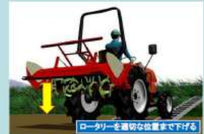
ロータリーを止め、地面にすらない位置まで下げ、重心を低くする