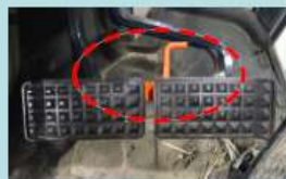
左右ブレーキの連結