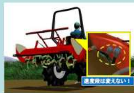
途中で変速しない