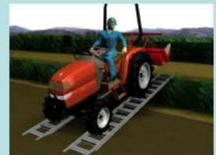
勾配が大きい場合、後進や歩み板を使用しましょう！