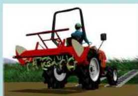
畦に直角に向ける