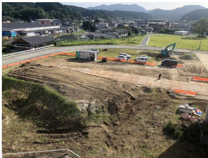
(増築棟建設予定地：着工前)