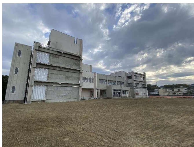
(旧校舎一部解体工事後)