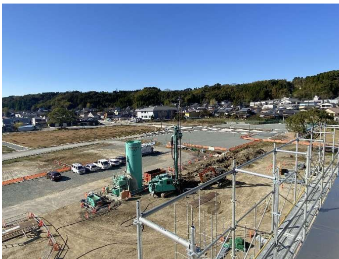
(増築棟建設予定地：12月現在)