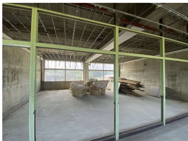
(旧校舎内装撤去工事)