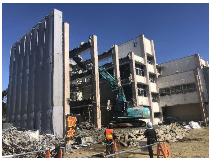
(旧校舎一部解体工事)