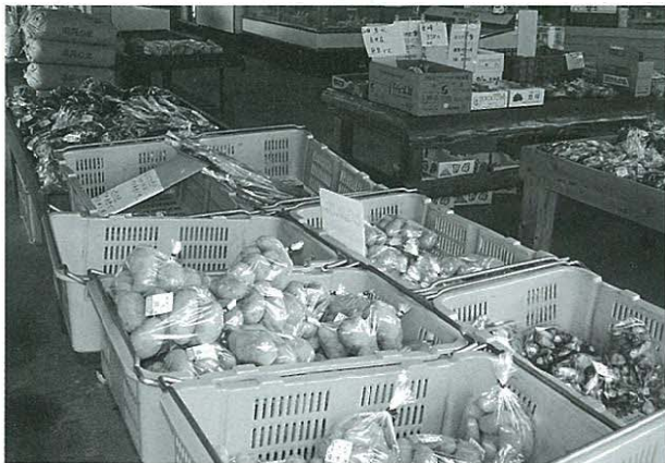
地元で採れた野菜。地産地消が求められる。

Q 南関町で採れた食材をどれぐらい使っているか。 A 教育課長 町内で生産された食材を使うよう心掛けています。米はすべて南関産米を使っている。野菜