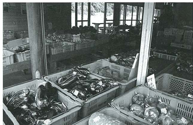
食料自給率の向上が求められる中、農業従事者の若がり急務と言える

Q 町長 大変厳しい財政状況の中で実施計画により実施している。現時点では計画に沿っていきたい。 A 町長 大変厳しい財政状況の中で実施計画により実施している。現時点では計画に沿っていきたい。