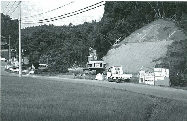
尾田一高久野線の拡張工事（質問の入札とは関係ありません）