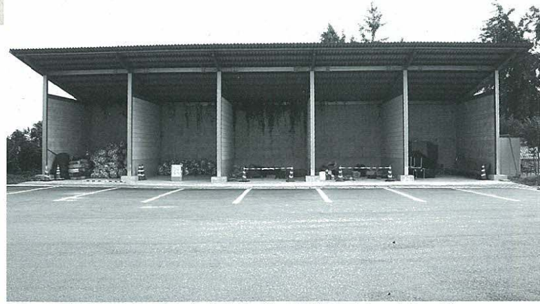
交流センター内にあるリサイクル資源のストックヤード

屋外運動場があるのでこれから耐震検査が必要だと思われる。したがって調査をしたいと思っています。 おし 教育長や課長はたまには給食センターを見に行って、南関町のどのような野菜が使われているかぐらいは把握しておくべきと思う。