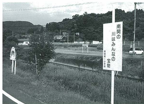
きれいな川を願って立てられた看板(写真は南関高校前)

A 住民課長 この工場は、関東にある高菜の漬物工場のことだと思いが、この工場は平成4、5年ごろから高菜の漬物を4月と12月の年2回、期間的に営業していると思ふ。資料等で調べてみると8年ごろ河川に汚濁の