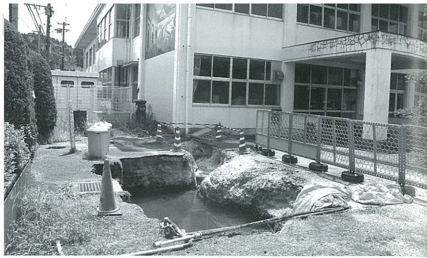
二小の灯油が漏れた現場