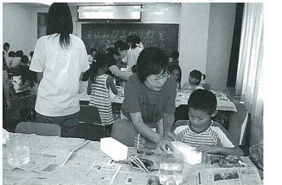
牛乳パックで自然や資源の大切さなどを学ぶ児童

A 副町長 今後においてもやはり河川の汚染に対する影響も強いと思つているので、関係工場にはきちつとした指導・監視等をしていきたいと思ふ。