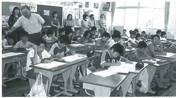
一人ひとりを大切にする学校づくりが求められている (写真は一小的授業参観)

Q 農道舗装や水路の整備もずいぶん進んでいるが、まだまだ整備が追いついていない。住民の要望も多い。予算を増やし対処しなければ中山間地の農業は遅れるばかりだ。 A 町長 大変厳しい財政状況の中で実施計画により実施している。現時点では計画に沿っていきたい。 Q 農業事情が悪い中で最近特に食料品など