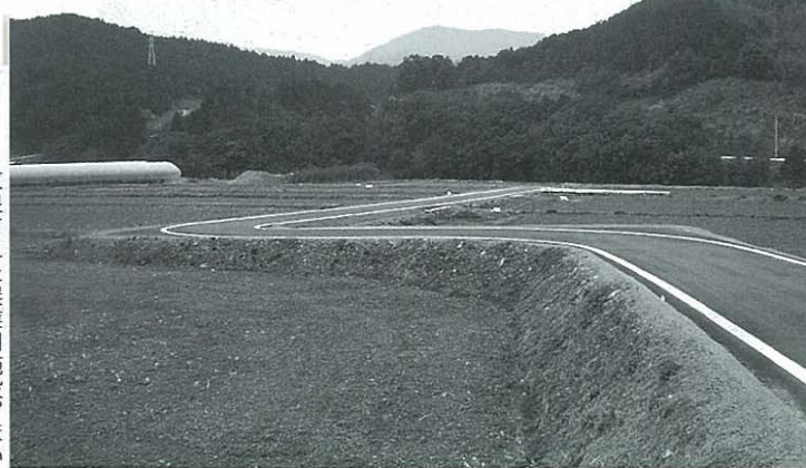
改良された農業用施設。ほかの箇所も整備が求められている。

Q 町長 大変厳しい財政状況の中で実施計画により実施している。現時点では計画に沿っていきたい。 A 町長 大変厳しい財政状況の中で実施計画により実施している。現時点では計画に沿っていきたい。