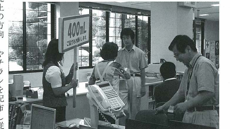
役場内で献血を呼び掛けました

献血を必要とされる 患者さんは、県内だ けでも2万4千人、一日 平均240人の献血が必 要とされている。多くの 皆さんが献血されるよう にお願いしたい。