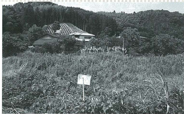
減反されている水田

①減反 Q 本年度は達成したか。 A 経済課長 南関町水田農業推進協議会を中心に、区長のご理解、ご協力があって、例年達成できている。平成20年度の実施状況につ