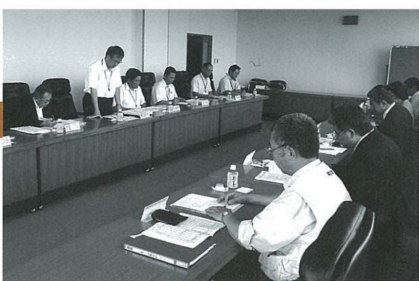
高鍋町役場で説明を聞く総務文教常任委員メンバー（手前）