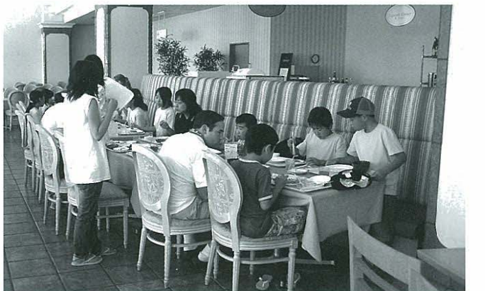
英語サマーキャンプのスナップ（アメリカの大学生とランチを楽しむ町内の小学生ら）

Q ①小中学校の二期制 A 町長 19年度の教育長は検討委員会を立ち上げて協議することになった。その後の結果を尋ねる。 Q 昨年一般質問の中で教育長は検討委員会を立ち上げて協議することになった。その後の結果を尋ねる。 A 教育長 19年度の動きは、教育委員会において検討委員会を20年度に設置しようという申し合わせをして、二期制について研究しようということになった。そして20年度には二期制は導入しないということになった。その理由としては全国的な数からみれば、二期制を導入している学校はまだ少ないからだ。三期制が続いてきているから、もう少しメリット、デメリットを検討しようというもの。 Q 21年度から二期制を導入するののか。 A 教育長 19年度の終わりに、推進委員会を導出して二期制を導入したかどうかという話をし、申し入れをして、本年5月に第二回の教育委員会です二期制を導入する方向で進むという確認をとり、推進委員会という名前で発足することになった。今、準備を進 Q 荒尾・玉名地区で小中学校の二期制を導入している学校はどれくらい A 各小中学校長、教務主任、PTA会長、各学校の代表者、教育委員会がメンバーになって Q 指導者要領の改訂もするので、授業時間が増えることになる。6月、7月には推進会議を開いていろいろ研究に取り組んでいくことになった。 A 教育長 荒尾・玉名管内では、中学校は南関中学校だけが二期制をとっていない。あとはすべて二期制をとっている。小学校については玉名市、玉東町、長洲町、和水町は全部二期制をとっている。荒尾市が11の小中学校のうち3校が二期制をとっている。 Q 総務課長 経緯を説明すると平成20年4月22日、午前10時から執行した指名競争入札のうち、草村地区溜池ほか3件測量設計業務委託の入札において、8社を指名し、全社からの応札があった。通常通り開札した際、実際は2、130万円が全入札額を、誤って213万円と読み上げ、この213万円が全入札額の最低価格であったため、落札となった。ところが解散後、工期等を示し、契約書を渡す段階になり、当該社員から入札書を見せてほしいとの要請があり、確認をしたところ、読み上げた213万円 Q ④入札開札の手違い A 町長 中学校までの医療費対策と橋本議員が言うように、私は両方が言っても出発するのではないかと思ってる。 Q ある工事の入札で落札金額と事業名を発表し、契約の時に金額の訂正をすることがあったと聞いた。これはどうい A 総務課長 経緯を説明すると平成20年4月22日、午前10時から執行した指名競争入札のうち、草村地区溜池ほか3件測量設計業務委託の入札において、8社を指名し、全社からの応札があった。通常通り開札した際、実際は2、130万円が全入札額を、誤って213万円と読み上げ、この213万円が全入札額の最低価格であったため、落札となった。ところが解散後、工期等を示し、契約書を渡す段階になり、当該社員から入札書を見せてほしいとの要請があり、確認をしたところ、読み上げた213万円