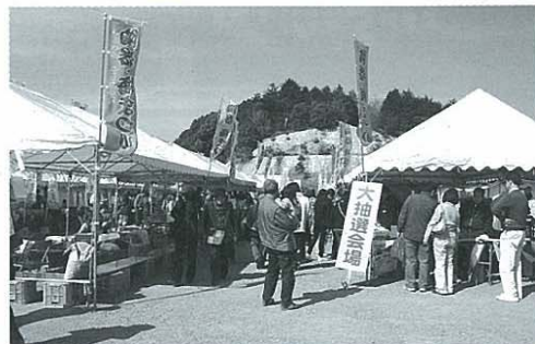
にぎわいをみせる町の二大まつりの一つ 「陶器梅まつり」(写真は今年の様子)

Q 町長 関所まつりの場 所、駐車場の問題と思う。 A 関所まつりのメイン行事は 大名行列。豊前街道沿いで あることや御茶屋跡があること に意味があるのではないかと。陶 器梅まつりでは復元された史跡 瀬の上窯跡、瓶焼窯跡や国指定 の小代焼窯元、梅の木がたくさ んある古小代の里公園で開催す ることに意味があると思うがど うか。 Q 経済課長 特に関所まつ りについては駐車場問題、 あるいは職員の負担、マンネリ化 面祭りの行革推進の観点から。 Q 予算削減や職員の負担軽減 が大きな理由ならば、ま まつりの縮小も含め、お客さん から駐車料金を取ることや有料 イベントにすることで解決 できないか。 A 副町長 自主運営 そして自主財源に着 目して、例えばTシャツ販 売などで財源確保をしては どうかと思う。 Q まつり実行委員会の みで決定できる問題 だろうか。 A 町長 最終的には 私の判断と思う。