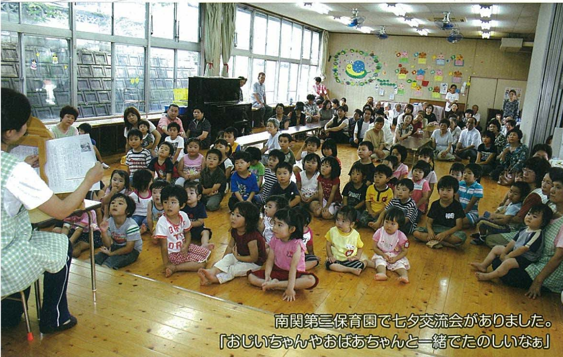
南関第三保育園で七夕交流会がありました。 「おじいちゃんやおばあちゃんと一緒にたのしいなあ」