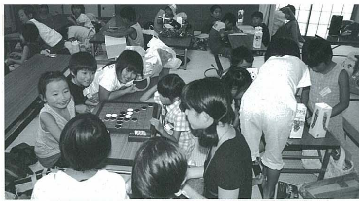
町公民館でオセロゲームをして盛りあがる子どもたち

Q ①町独自の少子化対策 有効な少子化対策は定住化 につながる。大規模な予算 が必要な事業は長期の計画が必要 なため、何か研究中の案はある のか。 A 町長 医療費の助成枠を 義務教育が終わるまで拡大 することを検討している。 Q 小学校の統合とマイクロバ ス事業の研究も始める時期 ではないかと思うがどうか。 A 教育長 今の状態は非常に 理想的と思う。今のところ あと5、6年は大丈夫。統合する となると地域の方の意見や経済 的な問題もある。 Q 統合して多学級にした方が 生徒の競争力や先生の指導