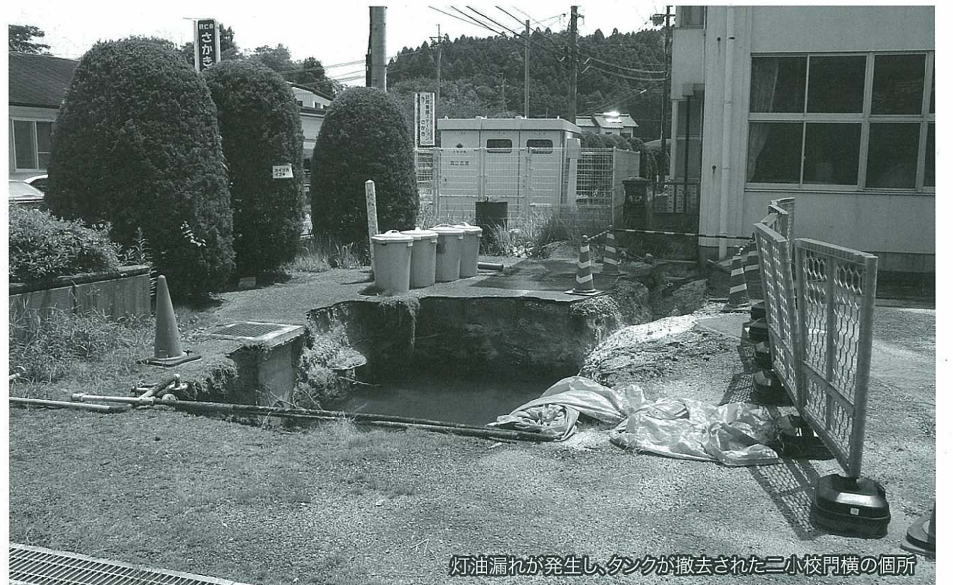
灯油漏れが発生し、タンクが撤去された二小校門横の個所