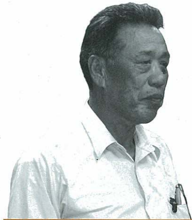
11番議員・副議長 鈴木清一