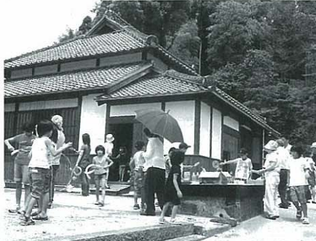
町内には御茶屋跡などPRできる史跡も多い

Q 町長 大変厳しい財政状況の中で実施計画により実施している。現時点では計画に沿っていきたい。 A 町長 大変厳しい財政状況の中で実施計画により実施している。現時点では計画に沿っていきたい。