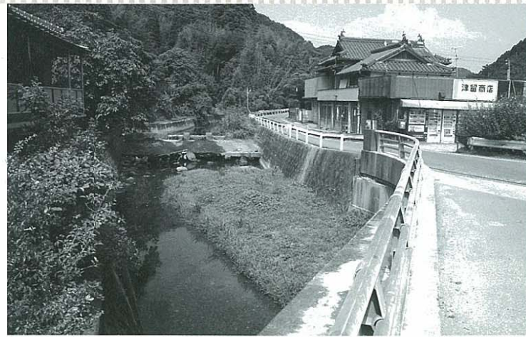
問題となった関東の井手の上橋付近