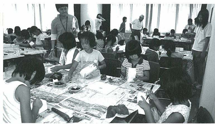
町や国の将来を担う子どもは町の宝。充実の支援が必要だ。