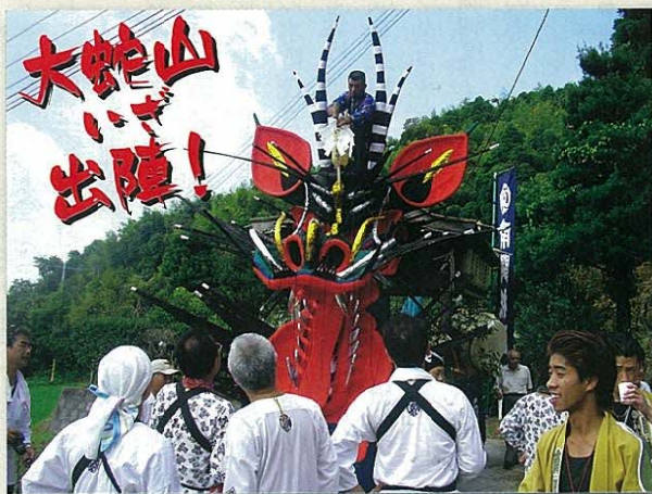
8月2日におこなったなんかんぎおんさん