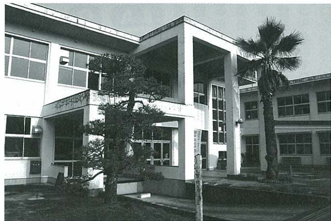
調査対象となっている小学校舎

いては、転作目標面積327.3鈔に対し、転作面積333.9鈔となっている。転作超過面積6.6鈔、達成率は102%になっている。 Q 協力する人、しない人何らかの差をつけることはできないのか。 A 町長 農政局に尋ねたが、基本的にペナルティーはないというこ