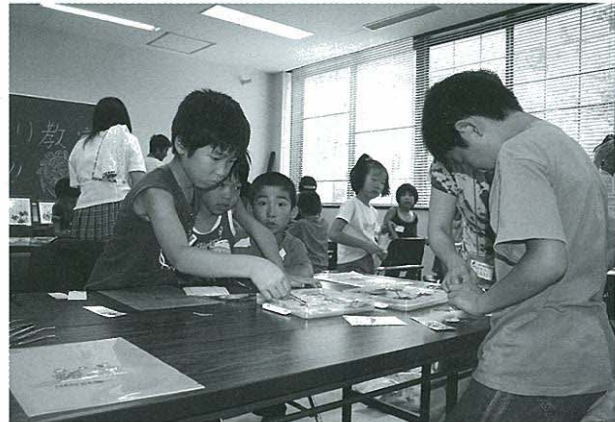
町社協のひまわり教室で工作をする子どもたち

Q ①小中学校の二期制 A 町長 19年度の教育長は検討委員会を立ち上げて協議することになった。その後の結果を尋ねる。 Q 昨年一般質問の中で教育長は検討委員会を立ち上げて協議することになった。その後の結果を尋ねる。 A 教育長 19年度の動きは、教育委員会において検討委員会を20年度に設置しようという申し合わせをして、二期制について研究しようということになった。そして20年度には二期制は導入しないということになった。その理由としては全国的な数からみれば、二期制を導入している学校はまだ少ないからだ。三期制が続いてきているから、もう少しメリット、デメリットを検討しようというもの。 Q 21年度から二期制を導入するののか。 A 教育長 19年度の終わりに、推進委員会を導出して二期制を導入したかどうかという話をし、申し入れをして、本年5月に第二回の教育委員会です二期制を導入する方向で進むという確認をとり、推進委員会という名前で発足することになった。今、準備を進 Q 荒尾・玉名地区で小中学校の二期制を導入している学校はどれくらい A 各小中学校長、教務主任、PTA会長、各学校の代表者、教育委員会がメンバーになって Q 指導者要領の改訂もするので、授業時間が増えることになる。6月、7月には推進会議を開いていろいろ研究に取り組んでいくことになった。 A 教育長 荒尾・玉名管内では、中学校は南関中学校だけが二期制をとっていない。あとはすべて二期制をとっている。小学校については玉名市、玉東町、長洲町、和水町は全部二期制をとっている。荒尾市が11の小中学校のうち3校が二期制をとっている。 Q 総務課長 経緯を説明すると平成20年4月22日、午前10時から執行した指名競争入札のうち、草村地区溜池ほか3件測量設計業務委託の入札において、8社を指名し、全社からの応札があった。通常通り開札した際、実際は2、130万円が全入札額を、誤って213万円と読み上げ、この213万円が全入札額の最低価格であったため、落札となった。ところが解散後、工期等を示し、契約書を渡す段階になり、当該社員から入札書を見せてほしいとの要請があり、確認をしたところ、読み上げた213万円 Q ④入札開札の手違い A 町長 中学校までの医療費対策と橋本議員が言うように、私は両方が言っても出発するのではないかと思ってる。 Q ある工事の入札で落札金額と事業名を発表し、契約の時に金額の訂正をすることがあったと聞いた。これはどうい A 総務課長 経緯を説明すると平成20年4月22日、午前10時から執行した指名競争入札のうち、草村地区溜池ほか3件測量設計業務委託の入札において、8社を指名し、全社からの応札があった。通常通り開札した際、実際は2、130万円が全入札額を、誤って213万円と読み上げ、この213万円が全入札額の最低価格であったため、落札となった。ところが解散後、工期等を示し、契約書を渡す段階になり、当該社員から入札書を見せてほしいとの要請があり、確認をしたところ、読み上げた213万円