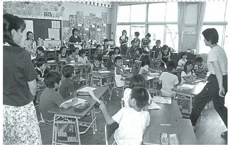
二期制が検討・研究されている町内の小中学校