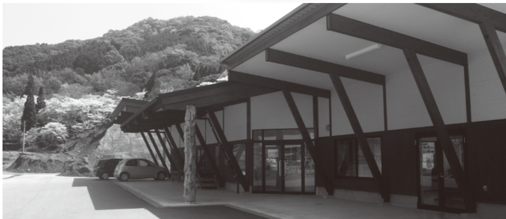
南関ふるさと応援団事務所