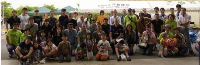
▲家族同伴BBQイベント「ファミリーデー」