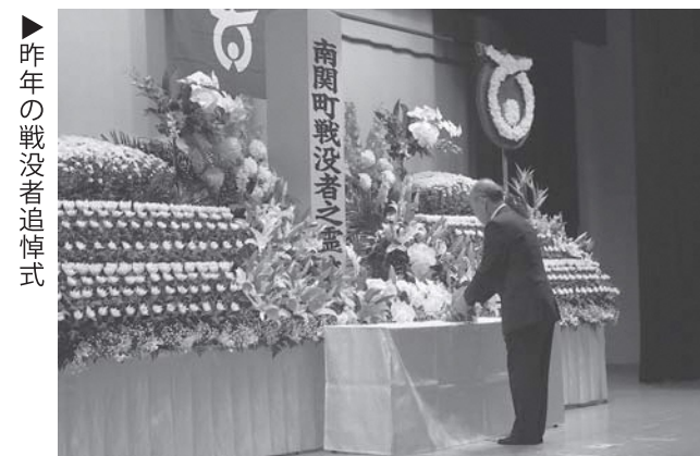
▶ 昨年の戦没者追悼式