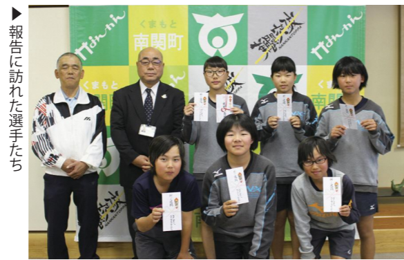
報告に訪れた選手たち

訪れた3人は「とてもよくできていて、頑張ったかいがあった」「三小のことを知ってほしい」「卒業生にも見てほしい」と笑顔で話しました。今後は庁舎窓口での放映や、関所健康マラソンなどで歌を披露する予定です。