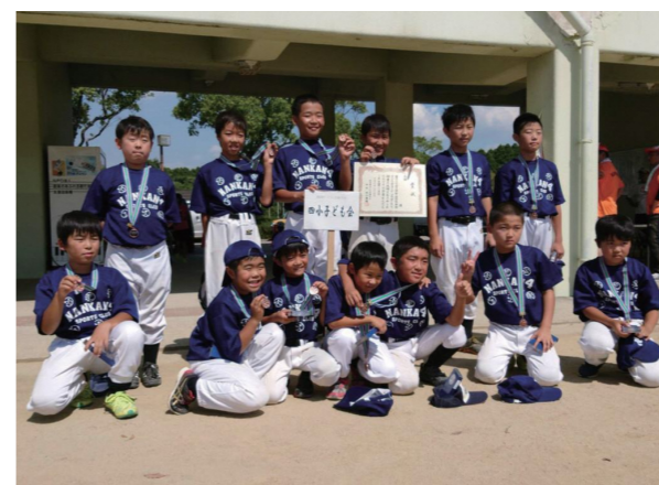
▲ 四小子ども会チーム(四小) 3位入賞