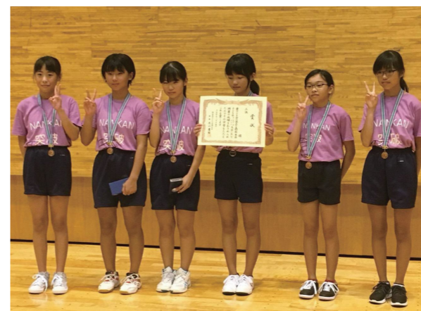
▲ じょいふるチーム(一小) 3位入賞