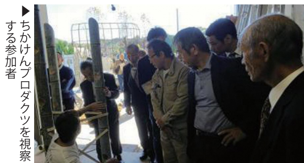
ちかけんプロダクツを視察する参加者