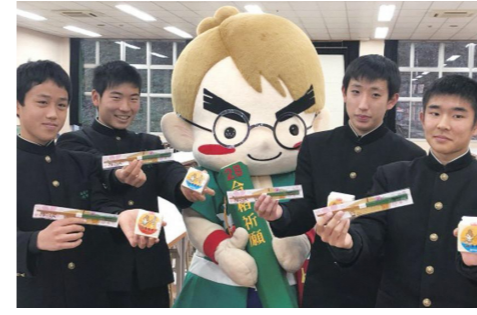
▲ 寄贈された箸、米を手を持った生徒たち