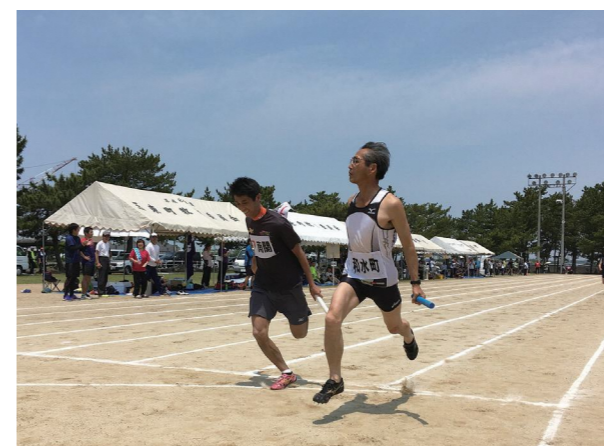
▲混合リレー同着ゴール