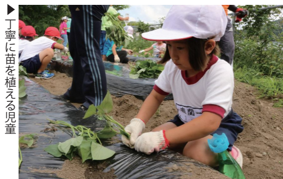
丁寧に苗を植える児童