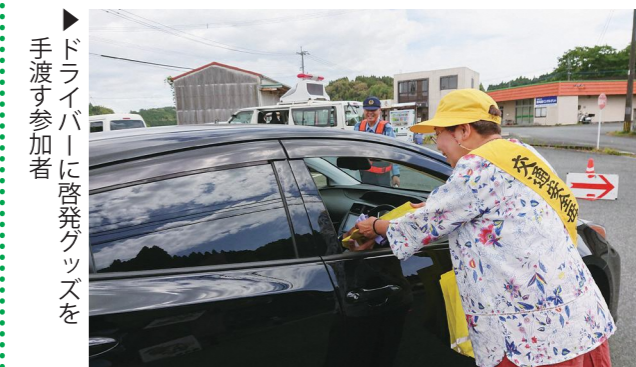
▶ドライバーに啓発グッズを手渡す参加者

玉名署によると、町内では4月末現在、9件の交通事故が発生し、負傷者は14人、死者は0人でした。