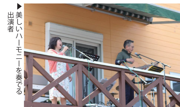
▶美しいハーモニーを奏でる出演者