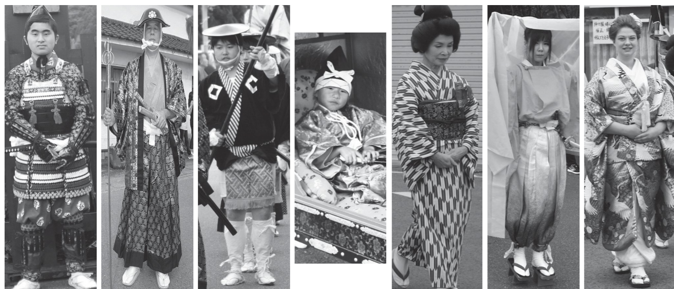
門番 侍 奴 稚児 腰元 小姓 姫