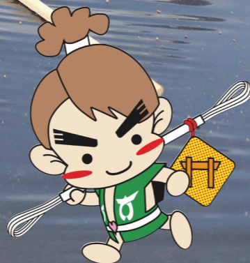
町のマスコットキャラクター