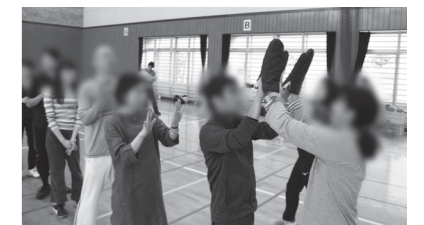
▲ミニ婚活運動会で軍手リレーをする参加者

イベントではなんかんトッパ丸が登場し、参加者に激励と南関町のPRを行いました。また、最後のカップル発表では誕生したカップルを祝福しました。