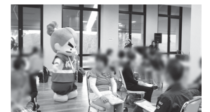
▲なんかんトッパ丸も応援にかけつけました