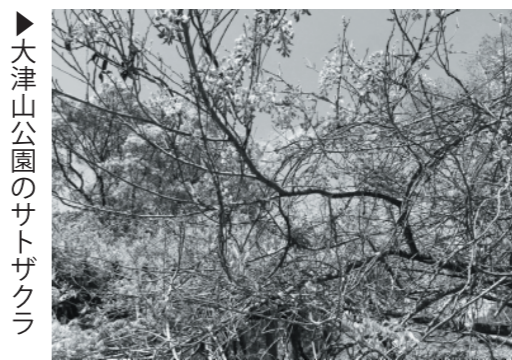
▶大津山公園のサトザクラ

レスを抱え込まないような工夫も個々で必要だと指摘がされているようです。下記の写真は、情報発信活動のために大津山で撮影を行なった際の一部画像を添付いたしました。(平野)