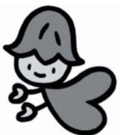
熊本県人権啓発キャラクター「ココロ」

【人権に関するお問合せ】 熊本県人権センター（熊本県人権同和政策課） ☎096-333-2300