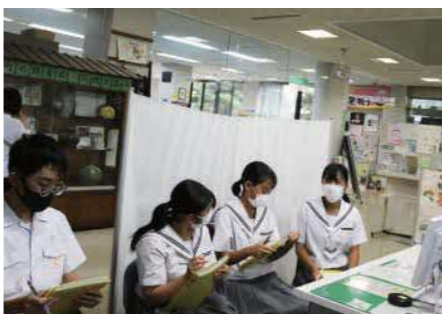
▲真剣に話を聞く生徒