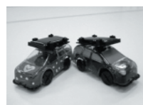
過去の作品「ソーラーミニカー」