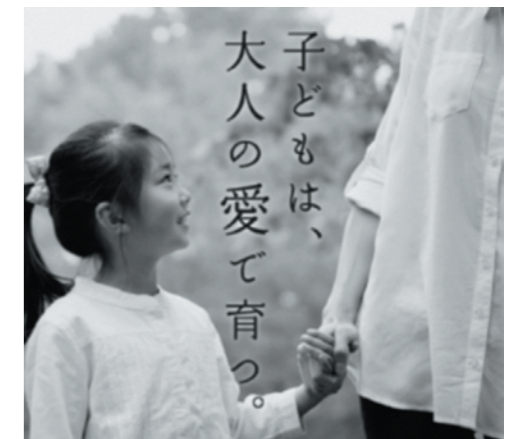
「里親」は、特別な存在ではありません。