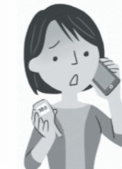
医療機関へ事前連絡