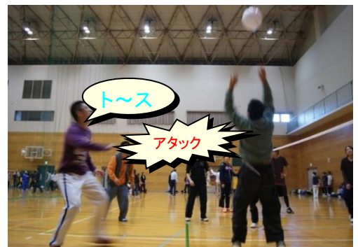
ビーチボールバレー大会