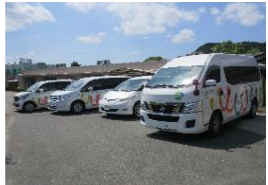
〔 充実した送迎車 〕