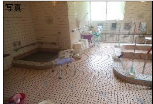
〔 解放感のある広々としたお風呂 〕