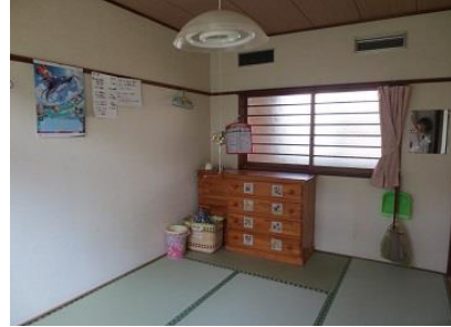
居室は1Fの2号室・2Fの1号室