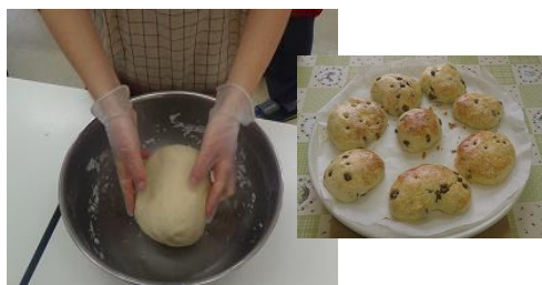
おやつ作り(スコーン)