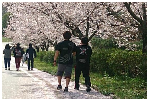
体力作り(ウォーキング)