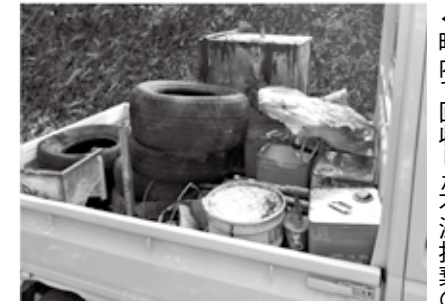
▲町内で回収した不法投棄の一部