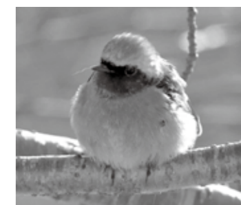
関川で撮影したジョウビタキ