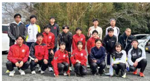
▲力走を見せた南関町チーム