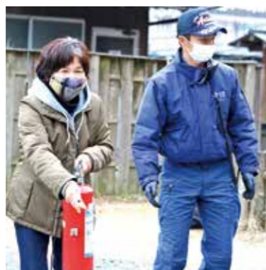
▶訓練に取り組む伝楽人

宮尾会長は「大切な文化財を守るために常日頃から火の取り扱いには注意している。毎年訓練に取り組むことが重要」と話しました。