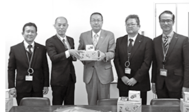
▲南関町と町内郵便局で協定を締結

注意事項: 郵便局で申請された方のマイナンバーカードは役場で受け取りになります。