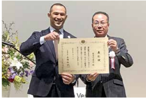
▲室伏広治スポーツ庁長官(左)、佐藤町長(右)

この表彰は、地域や職場における保健・栄養の改善およびスポーツ・レクリエーションの普及運動(体力づくり運動)を推進し、顕著な成果を上げている組織を文部科学大臣、体力づくり国民会議議長が表彰するものです。本年度は全国から3組織が表彰され、熊本県下では受賞第1号となりました。