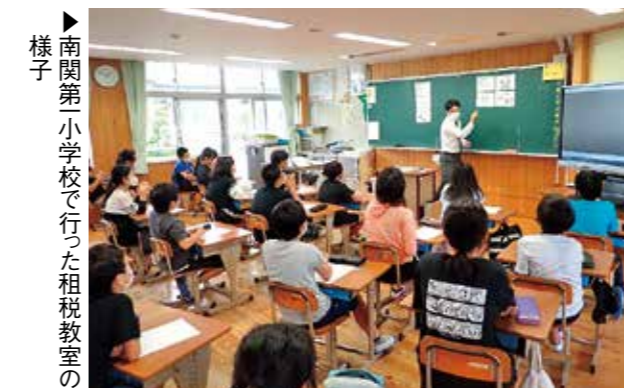
▶南関小学校で行った租税教室の様子

今年も役場税務住民課の職員や玉名税務署職員が町内小学校4校を訪問し、租税に関する授業を行いました。マグネットシートやDVD等を活用し、税金の使いみちや税金がなくなると自分たちの生活にどう影響するのか等を学びました。また、税金が使われているもの、使われていないものの選別や1億円の大きさや重さを感じてもらったため1億円のレプリカを持たせ、児童はその重さに驚いていました。