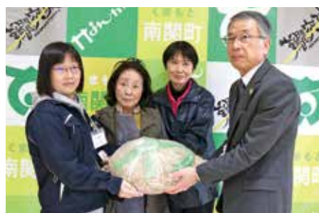
▲寄贈された手作り味噌13kg(中央)

寄贈された手作り味噌は、給食センターで調理された後、給食でみそ汁などとして子どもたちに届けられます。