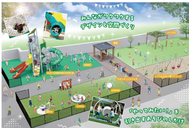
完成図 上側が高速道路方向になります。

令和7年度に始めました総合運動公園整備事業のI期工事が完了し、公園の西側に大型の遊具施設やユニバーサルデザイン遊具を備えた NankanT oppark が24日正午より一般共用を開始します。それに先立ち、9時より町内の3園の園児さんたちを招きオープンの記念式典を開きます。町長あいさつの後、テープカット、園児さんたちによる遊び初めを行う予定です。子ども達だけでなく、町民の皆さんがゆっくりと過ごせる施設ができあがりしました。どうぞ皆さんで、ご利用ください。