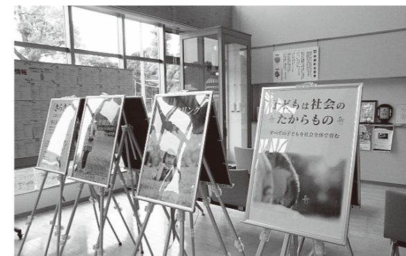
▲6月に実施したパネル展の様子