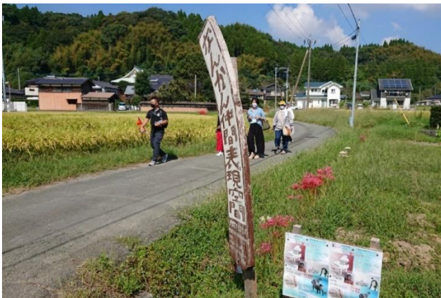
第1回WS（まち歩き）の様子