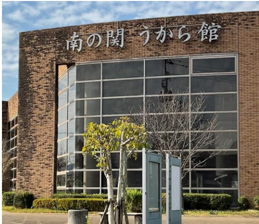
汚れや劣化が目立つ外壁