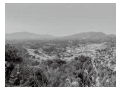
◀大津山山頂からの景色