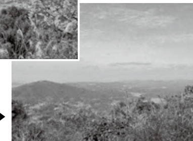
小岱山(長助金毘羅)からの景色 ▶