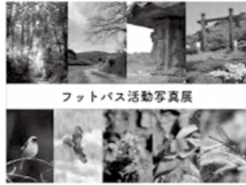
フットパス活動写真展

フットパスや活動内容についてのパネル展示、町内の景色や生きもの等の写真を掲示します。お気軽にお立ち寄りください。