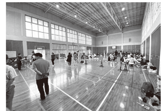
▲農業就業センターで演習をする職員

9月22日、鳥インフルエンザが発生したことを想定した防疫演習が、町農業就業センターと養鶏農場跡地で行われました。県主催で、鳥インフルエンザの流行期を前に防疫体制の確認や意識向上を目的に実施。県や町の職員など約150人が本番を想定した演習に取組みました。演習では、現場と支援センター間の人員輸送を中心に、円滑に防疫作業を行うためのマニュアルの検証や防疫体制の確認を行いました。