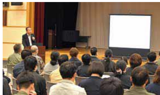
町政懇談会の様子