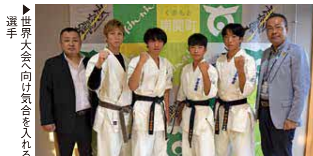
世界大会へ向け気合を入れる選手