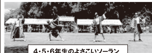
4・5・6年生のよさこいソーラン

5 月 25 日（日）に保護者・地域の方と一緒に運動会を実施しました。子どもたちは練習の成果を発揮して、ダイナミックに踊ったり、力いっぱい走ったり、一生懸命に応援したりと全力で取り組んでいました。地域の方にも競技に参加して頂き盛り上がりしました。地域の方ともふれ合える楽しい時間になりました。皆様の温かいご声援に感謝申し上げます。