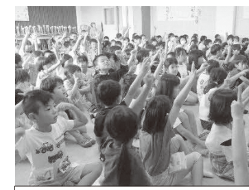
研究主任の話を聞きながら、「算 数の授業」における学び方を改め て確かめていきました。