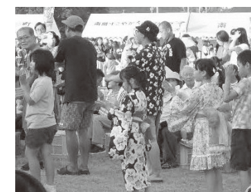
「ぎおんさん」当日の様子。3曲 目の「南関音頭」に合わせて入場 し、練習の成果を披露しました。