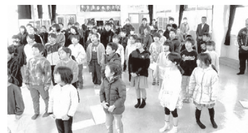
昨年の校内人権集会で歌っている様子

「ちゃんと向き合えたから」「言葉で伝え合ったから」「あのときいっしょにいてくれたから」など、すてきな言葉があふれている歌で、児童も先生たちも大好きな歌です。今年は、熊本県人権子ども集会（10月4日・熊本県立劇場）に全校児童で参加し、県内の人々にこの歌を伝えます。この歌がよりたくさんの人に知ってもらい、さらに広がってくれることを全校児童で願っています。