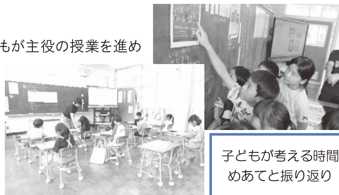
子どもが考える時間 めあてと振り返り

「よかった」を実感できる授業を目指して、子どもが主役の授業を進めています。特に今年度は、情報を読み解き、相手意識をもって話し・聞くことができるような工夫をしています。授業の中では、児童が自分の考えを持つ時間や、めあてと振り返りを大切にしています。全員の先生が、研究授業を行います。その際は、外部から講師の先生に来ていただき、より専門的な指導助言を受け、先生方の授業力もアップしていきます。