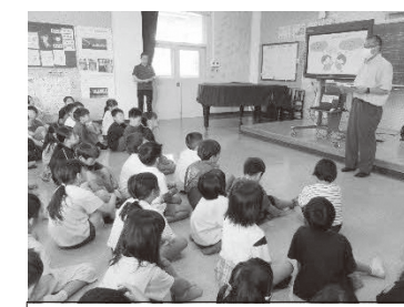
夏休み明け集会において、研究 主任から「学習者」である子供 たちに対して説明をしました。