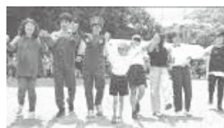
地域の方と一緒にマイマイム

5 月 25 日（日）に保護者・地域の方と一緒に運動会を実施しました。子どもたちは練習の成果を発揮して、ダイナミックに踊ったり、力いっぱい走ったり、一生懸命に応援したりと全力で取り組んでいました。地域の方にも競技に参加して頂き盛り上がりしました。地域の方ともふれ合える楽しい時間になりました。皆様の温かいご声援に感謝申し上げます。