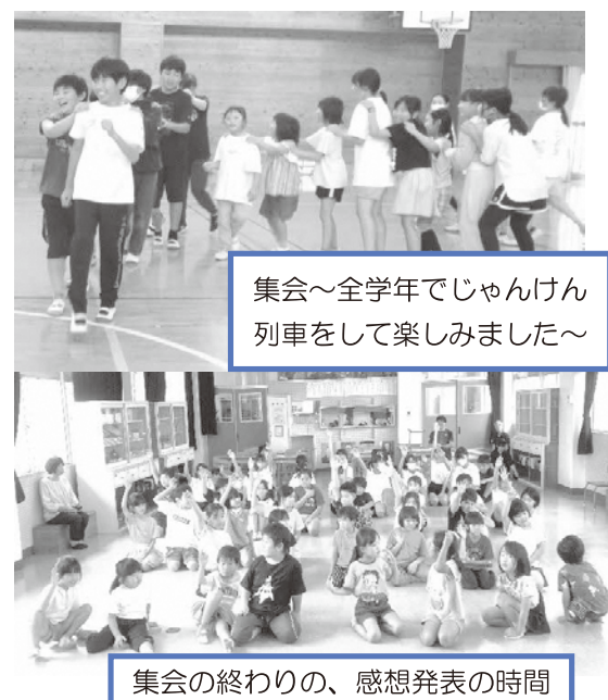
集会～全学年でじゃんけん 列車をして楽しみました～

二小は、1学年の人数が少ないので、他学年と交流する機会を多く作っています。縦割り班での活動や、集会の最後に振り返りの時間を作り、感想発表をしています。低学年でも、全校児童の前で堂々と発表することができるようになりました。また、避難訓練の振り返りを縦割り班で行い、自分たちで身を守る行動を考える時間も作りました。夏休み明けには、親子美化作業を行いました。地域の方の協力も得て大人も子どももやりきりました。協働・頑張る力を育てる活動があふれている南関二小です。互いを尊重し合い、優しい子どもへと育っていくと信じています。