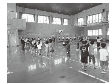
暑い中でしたが、体育館で大き な円を作って、繰り返し練習し ました。