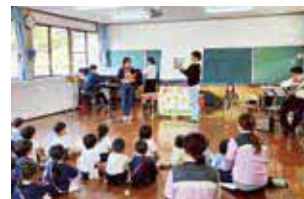
▲ひまわり幼稚園での様子

日頃の読み聞かせとひと味違った季節を取り入れたよみきかせ会となっており、ギターやピアノの演奏に合わせた歌とダンスでは、子どもたちもノリノリで一緒に楽しみました。