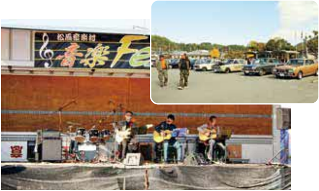
▲地元バンドによる軽快な演奏

マルシェやキッチンカーも出店し、来場者は晴れ渡る空の下、音楽やグルメなどを満喫し、休日のひと時を過ごしました。