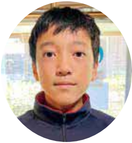
ほんだ つばさ 本田 翼さん