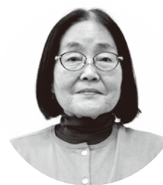
ひさし え 久 とり江