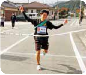
▲優勝した町下チーム ゴールの瞬間

12月7日、町は「第49回南関町駅伝大会」を開催しました。昨年より1チーム増え、11チームが出場した今大会は、役場をスタート・ゴールとする8区間17kmの町内をぐるりと一周するコースで実施。優勝は、圧倒的な差をつけ独走した町下チームとなり、笑顔でゴールテープを切りました。