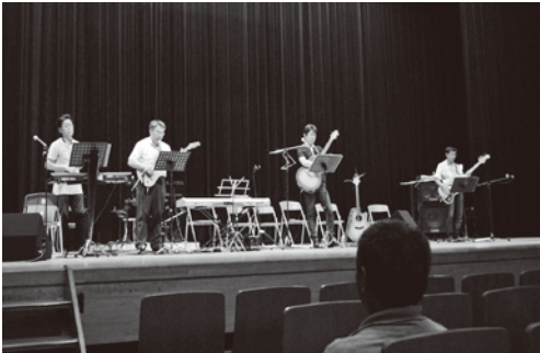
問 福祉課（南町民センター） ☎53-9543

第30回南関町人権フェスティバルを開催します。みなさまのご参加をお待ちしております。 ▶日時 令和8年2月1日（日） 午前9時～（受付8時30分～） ▶場所 南関町交流拠点施設〈ukara〉2階大ホール ▶プログラム ○学習発表 ・南関ひまわり幼稚園 ・町内各小学校／中学校 ・南関きずな解放子ども会 ○公演会 演題 『あなたのそばに人権を考えるきっかけが…』 講師 人権バンドゆう